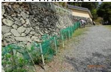
アジサイのネット掛け