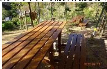
陽光桜苑のベンチ

・アジサイにネットをかけています。柳谷観音の周辺には1000本のアジサイを植樹していますが、最近野鹿が繁殖し、アジサイの花芽を食べに出没します。折角の花芽を食べられるとアジサイが咲きませんのでネットで防御作業を行っています、作業が大変です。