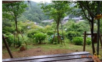
藤棚からの柳谷観音全景