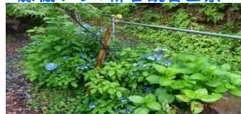
枯山水の黒姫アジサイ