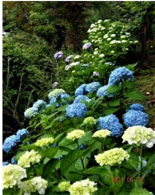
第1陽光桜苑のアジサイ